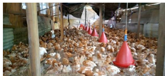
De kippenfarm in verval, maar toen nog in gebruik

Het komend jaar zal de Stedenband actief geld inzamelen voor de Kippenfarm met het project "Adopteer een kip". Op de website, in de pers en op locaties in Dordrecht zijn we komend jaar aanwezig. Kippen zijn in Kameroen de belangrijke bron van eiwit en proteïne. Helaas is het nog steeds onrustig in het Engelstalige deel van Kameroen, waardoor er weinig werk is en er voedselschaarste heerst. Zeker mensen met een beperking zijn daar de dupe van.